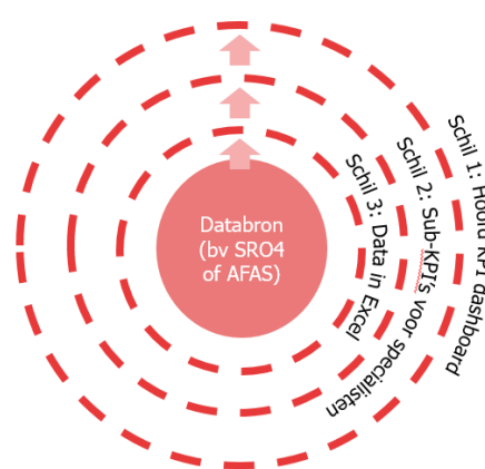
Figuur 1: de opbouw van het KPI Dashboard

Het hoofd-KPI 'sponsoring' is zo opgedeeld in shirt-sponsoring, business seats en ruimtes, bord-sponsoring, etc. Deze sub-KPI's worden niet op weekbasis besproken met het gehele team, maar worden beheerd door de toegewezen specialisten, in het geval van sponsoring de accountmanager. De specialisten hebben zo weer inzicht in waar nog werk gedaan moet worden om hun hoofd-KPI te halen. Achter het tabblad met de sub-KPI's hangt een tabblad met data; deze data voedt de voortgang van de sub-KPI's (gebruikt door de specialisten), welke op zijn beurt weer de voortgang voedt van de hoofd KPI's op het voorblad. De bron van de data kan SRO4 voor stadion gerelateerde KPI's zijn, of AFAS voor KPI's op financieel- of sponsorvlak (zie figuur 1 voor een visuele weergave van de opbouw van het KPI dashboard).